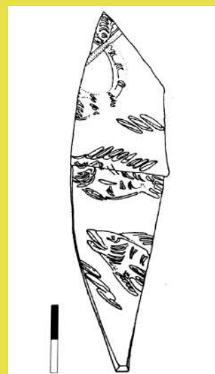
Pozzarello (Monsummano Terme): frammenti di piatto in vetro con incise immagini di pesci - III secolo d.C.