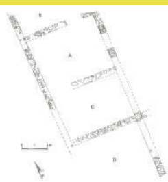
Via Cosimini (Pieve a Nievole) rilievo di un edificio di età romana