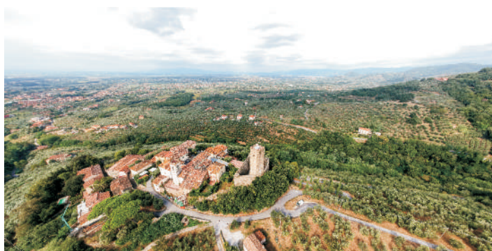
Panoramica del Castello e del territorio di Larciano