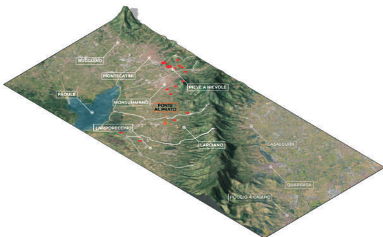
Localizzazione siti di epoca romana (in rosso)