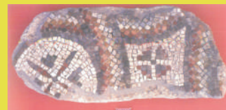
Pieveccia di Vaiano (Monsummano Terme) frammento di mosaico policromo